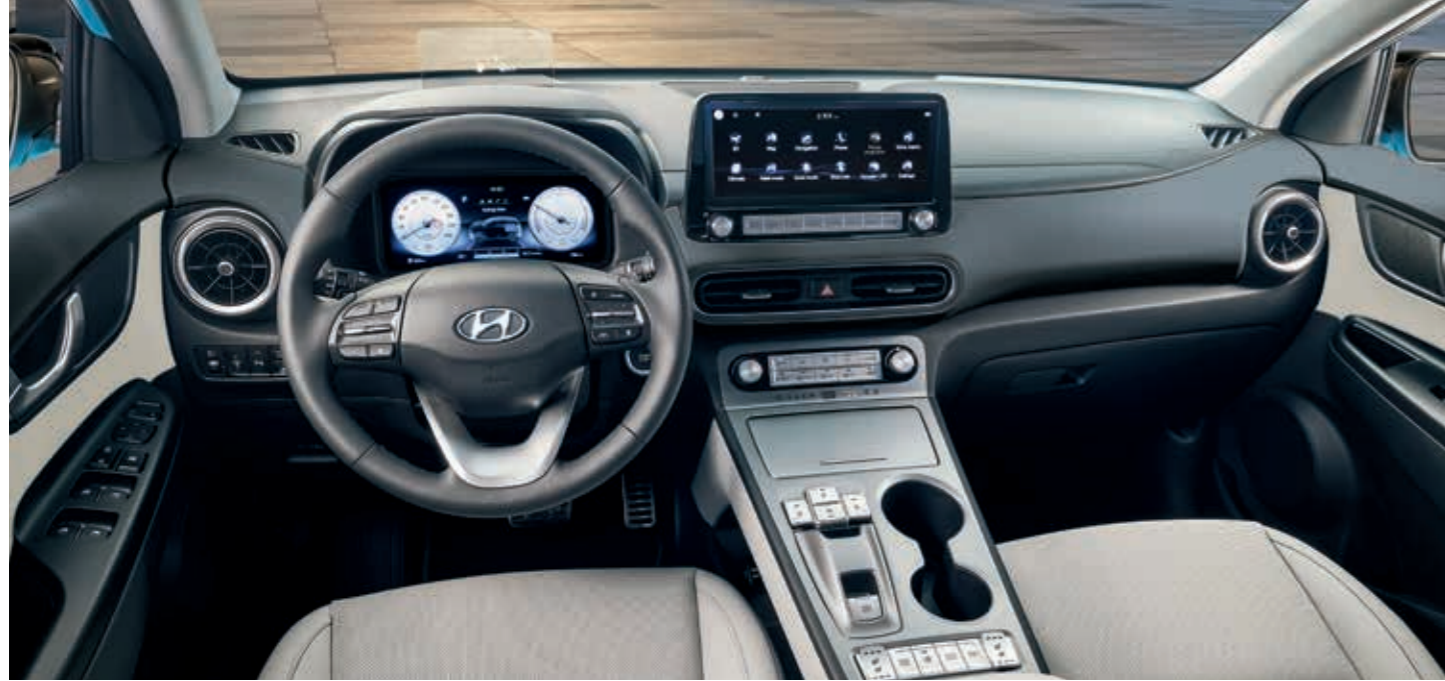
Görseller, Türkiye pazarında satışa sunulan araçlardan farklılık gösterebilir.

Yeni gösterge ekranının genişletilmiş özellikleri kullanıcının Normal, Sport, Eco veya Cube görünüm temaları arasından seçimi yapmasına izin veriyor.