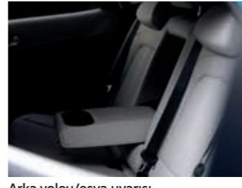
Arka yolcu/eşya uyarısı