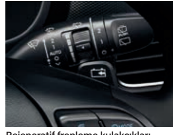
Rejeneratif frenleme kulakçıkları