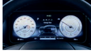
Tamamen dijital 10,25" gösterge bilgi ekranı

Araçta bulunan standart 11 kW dâhili şarj cihazı ile %100 şarj seviyesine yaklaşık 4 saat 20 dakika içerisinde ulaşılabilir. Araç ile birlikte sağlanan ICCB kablo ve standart ev tipi 230 V elektrik prizi ile 17 saatte tam şarja ulaşılabilir. (39,2 kWh batarya için geçerli değerlerdir.)