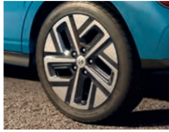
17 inç alaşım jant