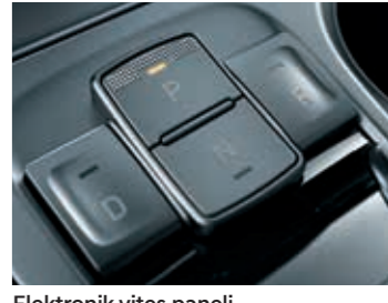
Elektronik vites paneli