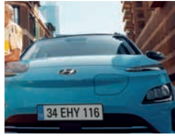
Akıcı aerodinamik tasarım