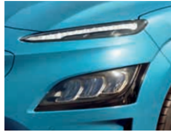
LED ön farlar