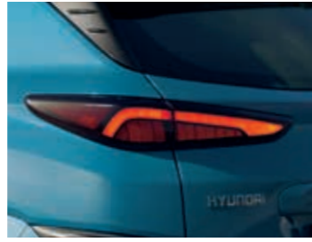
LED arka lamba grubu