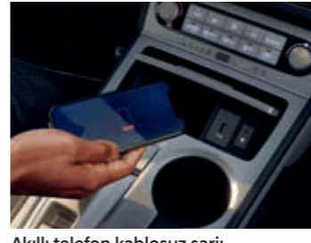
Akıllı telefon kablosuz şarjı